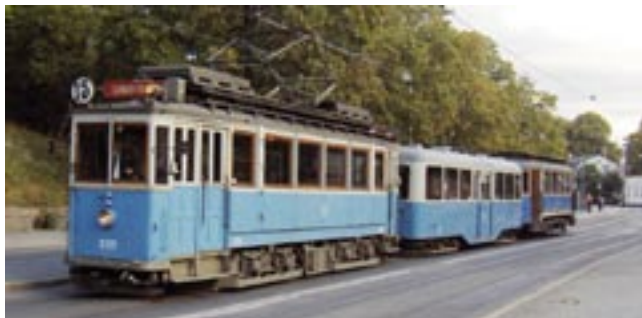
Här ses vårt utfärdståg på Djurgårdsvägen, framfört med säker hand av Ingvar Puke.